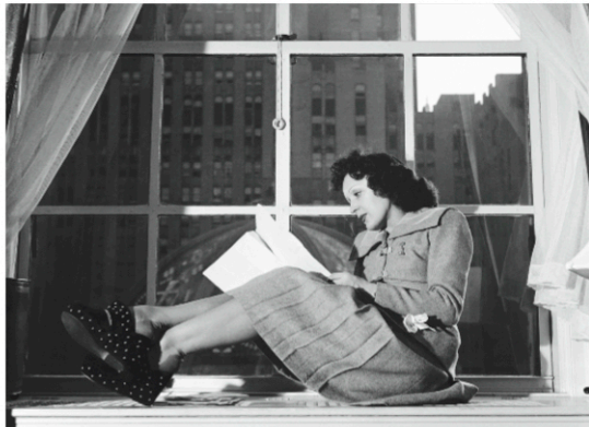
La comédie musicale mêlera des bandes originales en anglais et des compositions.

Elle revient ainsi sur la dimension américaine de la carrière d'Edith Piaf, de la fin de la Seconde Guerre mondiale à 1961. Évitant l'écueil de l'imitation, le spectacle réunira sur scène des interviews que la star a données entre 1950 et 1960, et des bandes originales enregistrées par Edith Piaf en anglais –