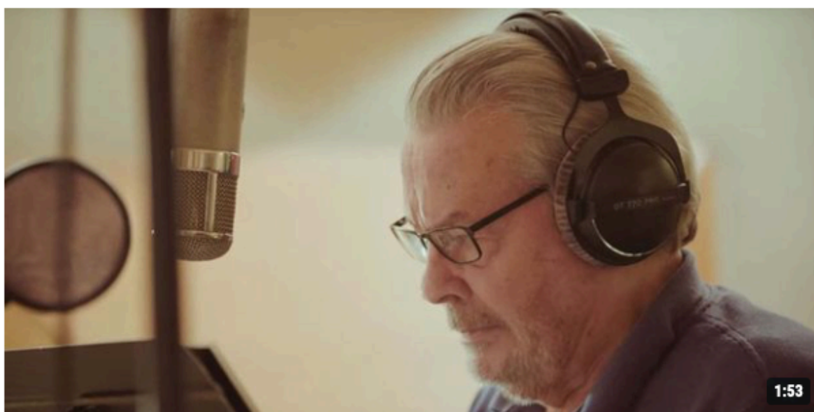
Alain Delon lors de l'enregistrement de "Je n'aime que toi".